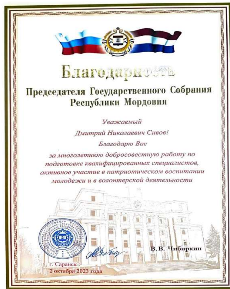
Благодарность Председателя Гос. Собрания РМ В. В. Чибиркина