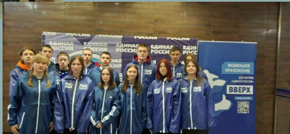
Волонтёры нашего техникума в рядах Молодой Гвардии Единой России