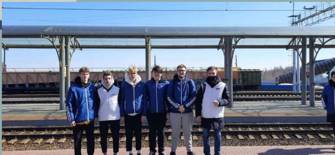
Апрель 2022 г. Встреча беженцев из города Мариуполь.