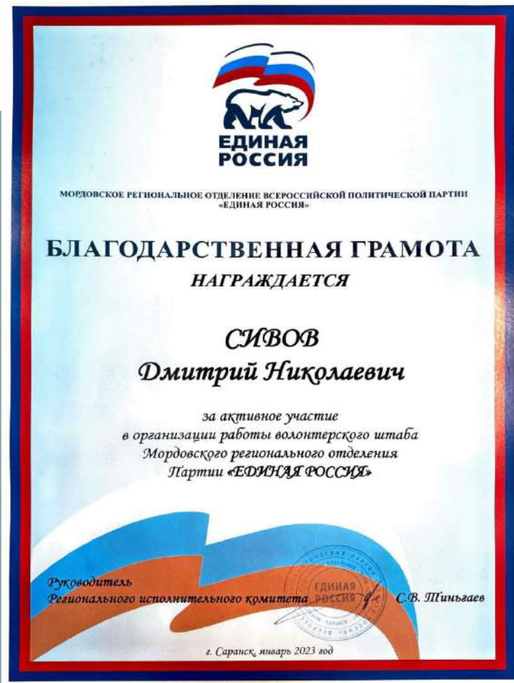
Благодарственная грамота партии Единая Россия за участие в работе волонтерского штаба