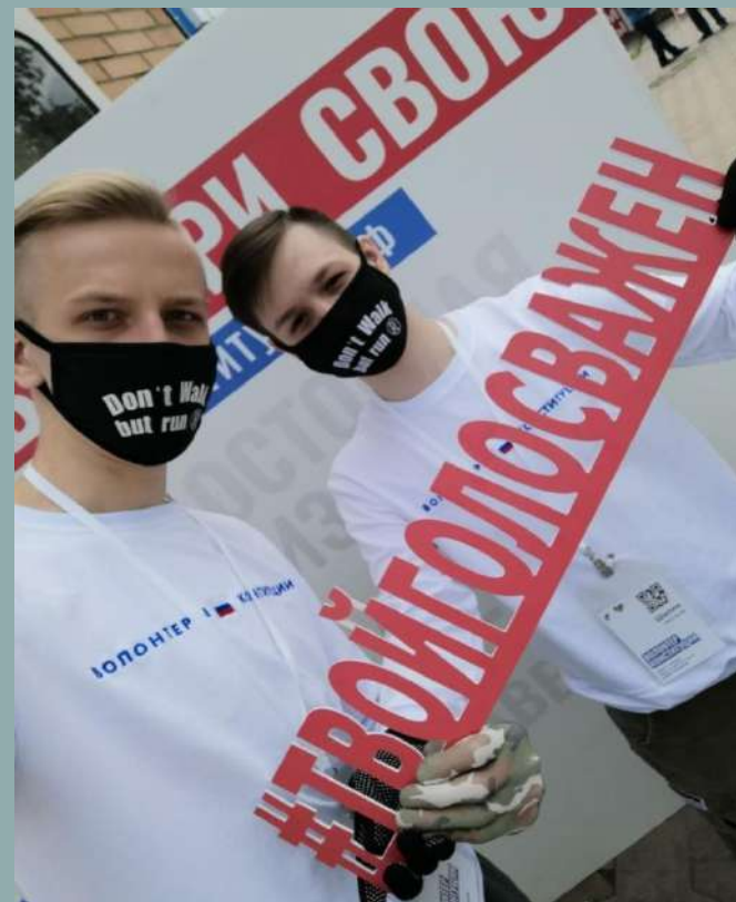
Просветительский проект «Волонтеры Конституции»