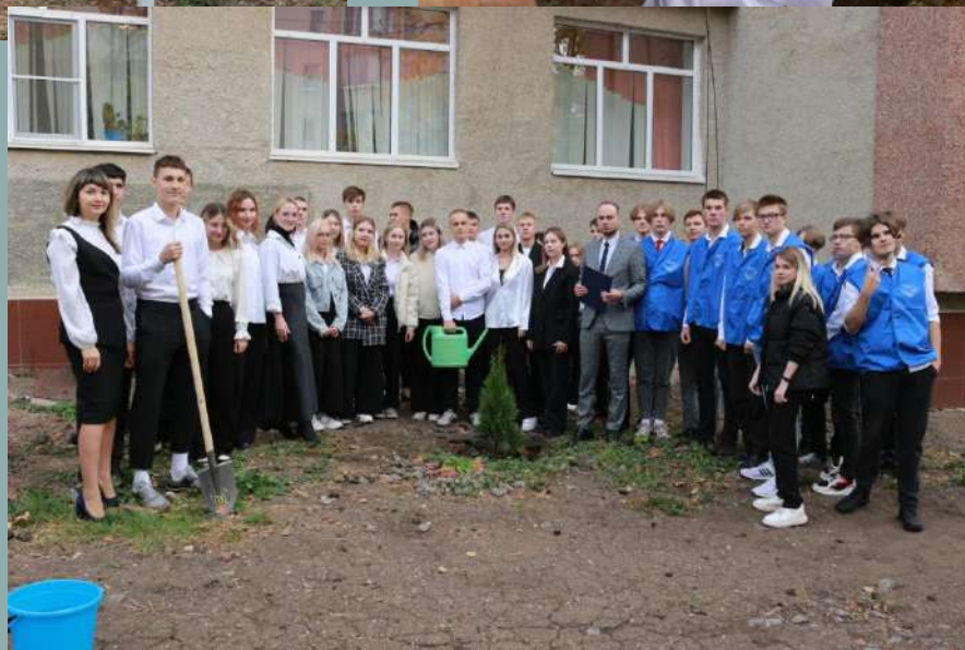
Высадка «Аллеи Педагога и Наставника» в честь Дня Учителя.