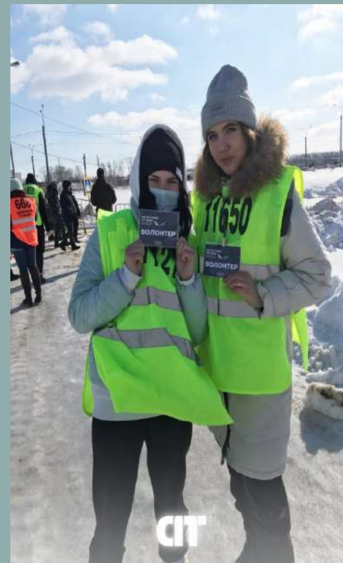
«Мотогонки на льду 2021: показательные выступления» .