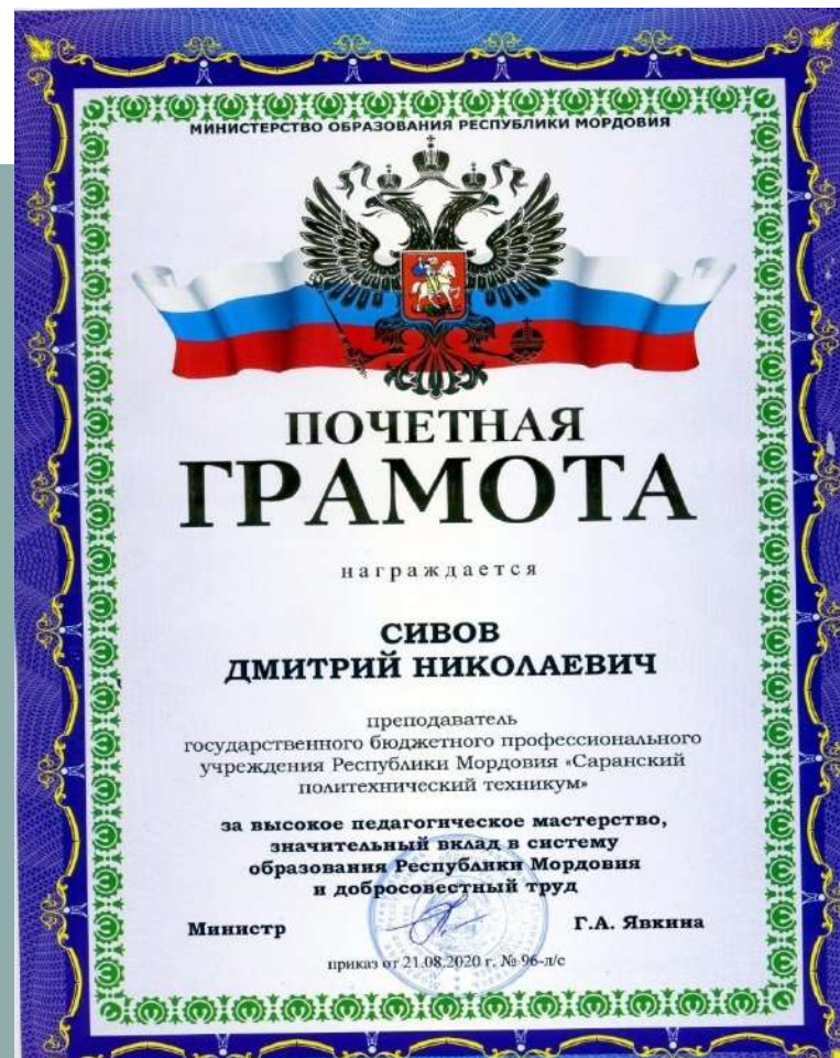
Почетная грамота Министерства Образования РМ