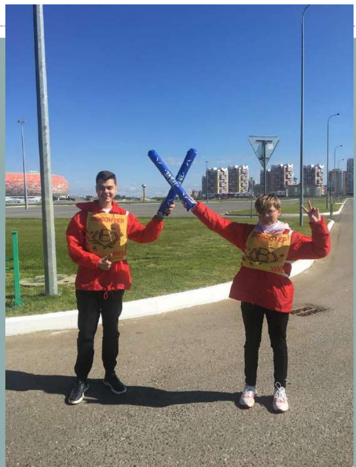
22 мая 2022 г. Всероссийский полумарафон ЗаБег.РФ