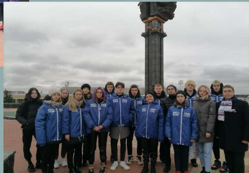
4 ноября 2022 Волонтеры возложили цветы к памятнику «Навеки с Россией»