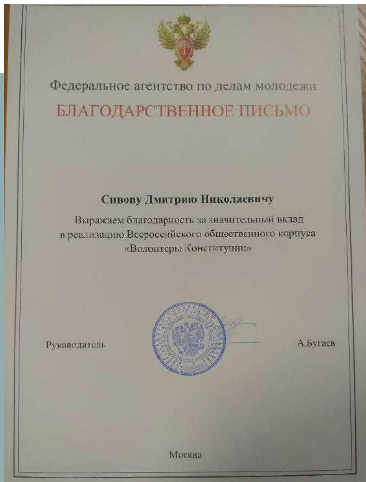
Проект «Волонтеры Конституции»